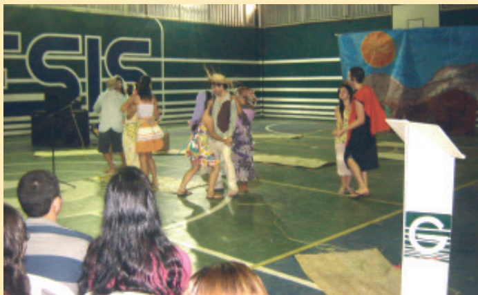
Apresentação do musical “Filhos do Sertão, Sol e Fé”