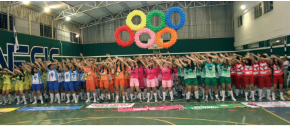
As seis equipes participantes da Movimentação Olímpica 2010