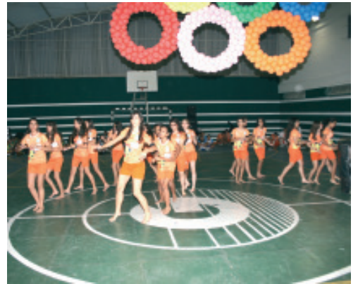
A Equipe Laranja foi a campeã