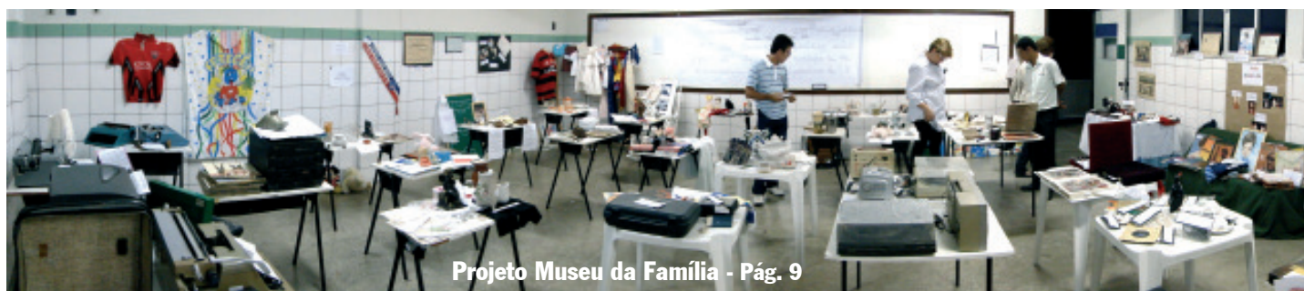
Projeto Museu da Família - Pág. 9

Movimentação Olímpica, evento de sucesso Pág. 12