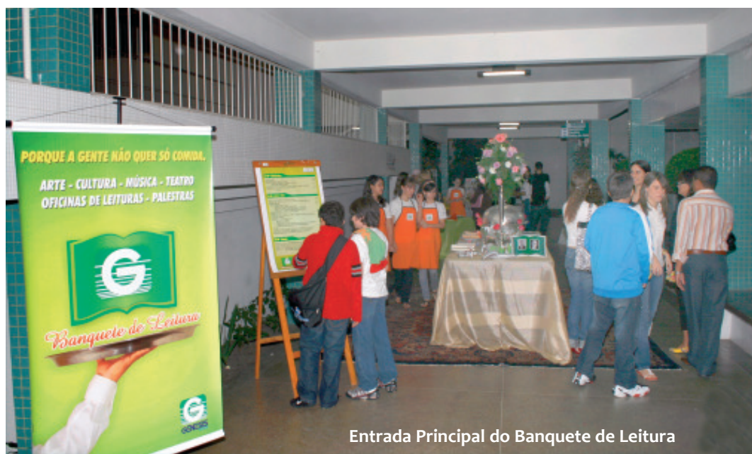
Entrada Principal do Banquete de Leitura

A Gastronomia Literária do Banquete de Leitura está sendo degustada durante os dias 22 e 23 de outubro, por professores, alunos de escolas particulares e públicas, pais, escritores, artistas, estudiosos, amantes da leitura e a comunidade em geral, que se deliciam com leituras de textos, declamações de poemas, exposições de artes, filmes, teatro, lançamentos de livros. E mais: a realização do Café Literário, que faz tributo com sabor especial luso brasileiro, ao poeinha Vinícius de Moraes, ao escritor português José Saramago e à escritora cearense Rachel de Queiroz. Página 6