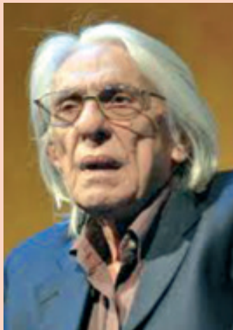
O “Traduzir-se” do poeta Ferreira Gullar

Depois da produção escrita e da revisão dos textos recriados, os alunos apresentaram suas