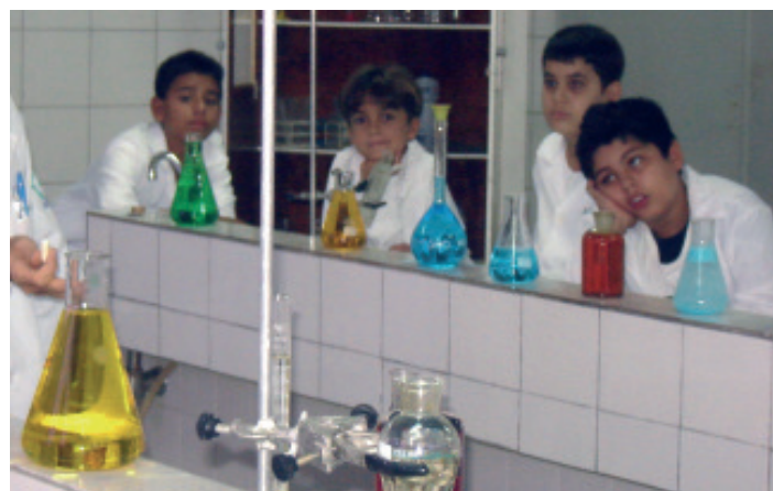
Alunos em aula de Química no laboratório do Colégio

Situações comuns como as relatadas a seguir mostram que é necessário o estudo da ciência. Imagine você que, há alguns anos, uma marca de óleo comestível de soja aumentou a sua venda porque o seu rótulo trazia a expressão “colesterol zero”, todavia todo produto de origem vegetal é isento de colesterol. Existem pessoas que não comem o pão do dia e, sim, o dormido, porque o fer-